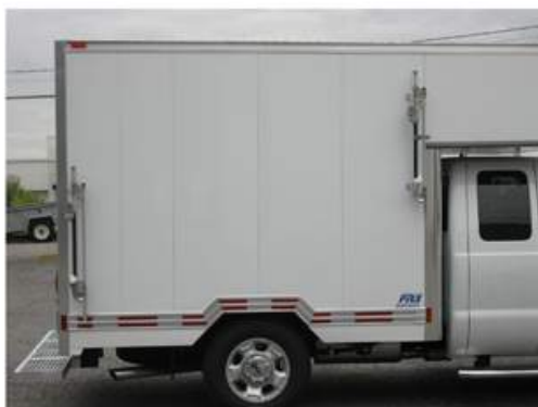
Support à échelle de côté