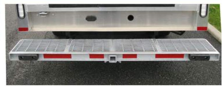
Pare-choc de modèle pleine largeur, extra robuste, entièrement galvanisé à chaud avec attache de remorque encastrée