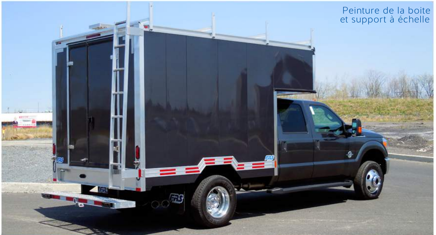
Peinture de la boîte et support à échelle