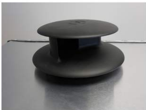
Ventilateur de toit "Flettner"