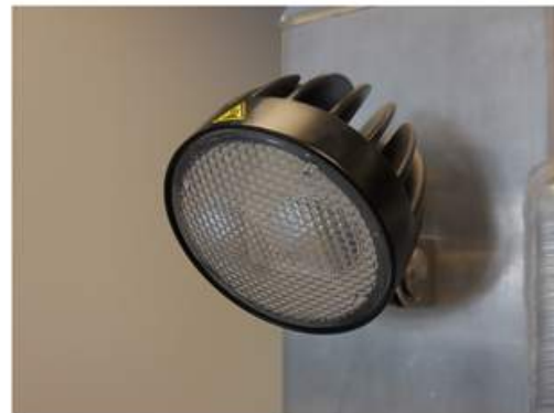
Lumière de travail au D.E.L.