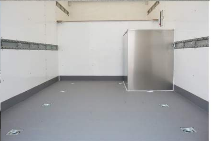
Plancher recouvert de Line-X avec enclages au plancher et boîtier de génératrice