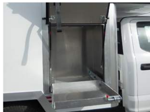
Porte de côté avec plateau installé sur glissières