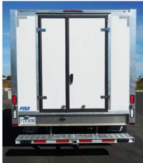
Deux portes arrières, 20" et 30"