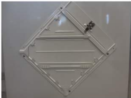
Support à placard de matières dangereuses