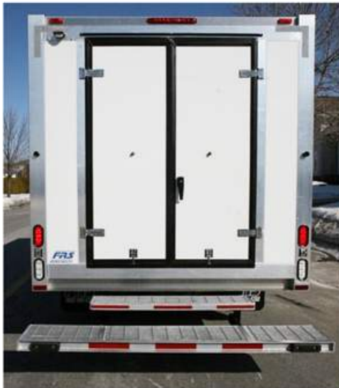
Deux portes arrières, 25" chaque.