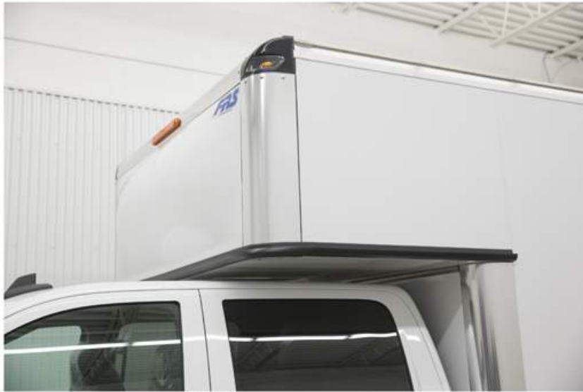
Allonge de cabine de 42" avec déflecteur d'air intégré