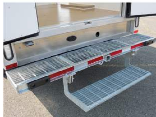
Marche rétractable sur pare-chocs