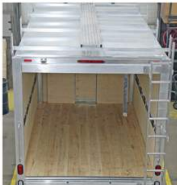
Support à échelle arrière et passerelle sur le toit