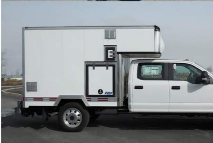
Porte de côté