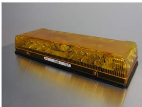
Strobe au D.E.L.