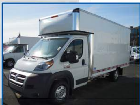
Option de rallonge de cabine de 36" de profondeur avec gouttière