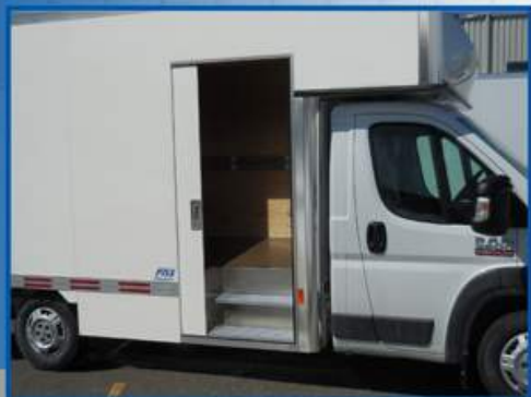
Porte de côté coulissante avec marche pied