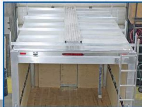
Support à échelle avec passerelle