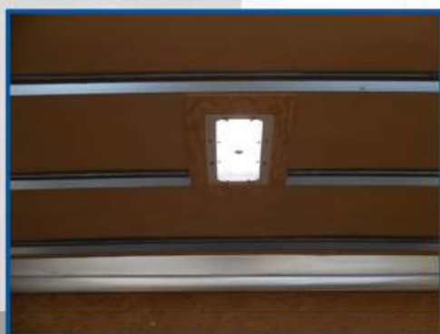
Plafonnier encastré de type Grote D.E.L. avec détecteur de présence à infrarouge (sans interrupteur)