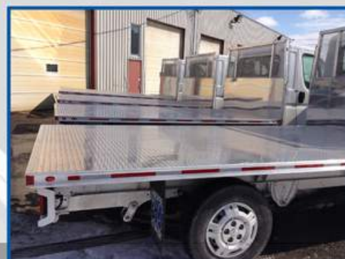
Véhicule adapté à recevoir une plateforme en aluminium (Châssis Cab uniquement)