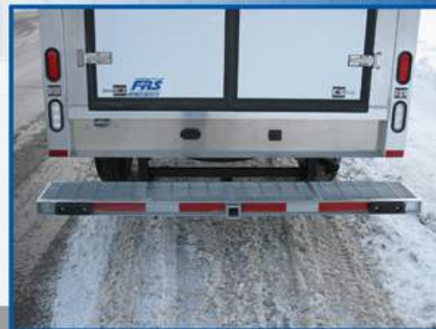
Pare-chocs extra robuste entièrement «galvanisé à chaud» avec attache de remorque encastrée