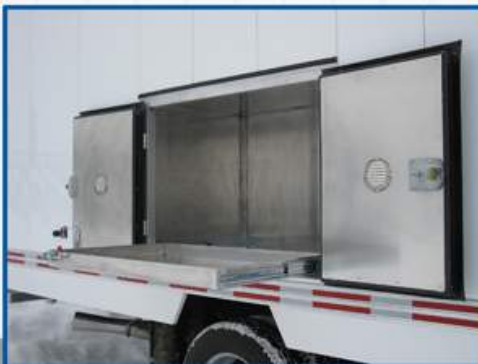
Coffre de deux portes ventilées avec plateau installé sur glissières