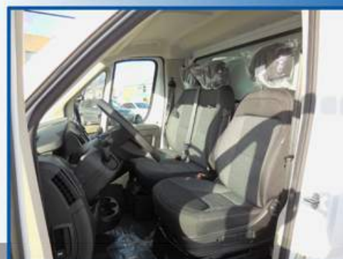
3 places sur le modèle «Châssis Cab»