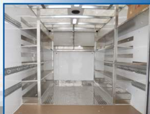
Finition intérieure en «Loan Plastique», toit translucide, différents types de tablettes de rangement en aluminium

Voici un camion à cabine tronquée dont le PNBV est de moins de 4500 kilos. Fini les balances, les inspections et les pertes de temps. Grâce à sa structure d'aluminium très légère, cette camionnette peut quand même avoir une capacité de charge de plus de 3500 lbs.