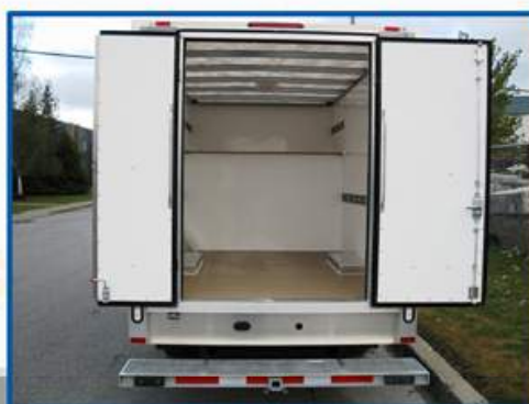
Deux portes avec ouverture totale de 50" Gauche : 20" Droite : 30"