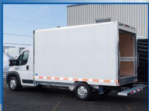
Toutes nos fourgonnettes ont un seuil de porte très bas facilitant l'embarquement pour l'utilisateur