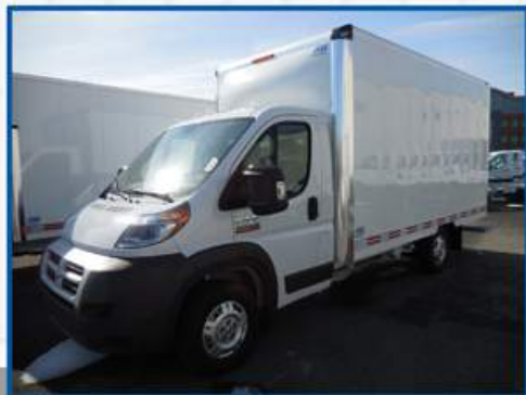
Défecteur d'air de série sur toutes nos fourgonnettes