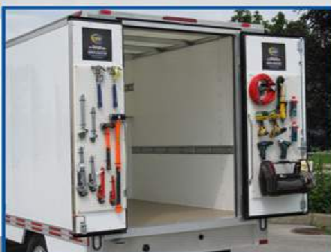
Possibilité d'accrocher les outils sur les portes arrière