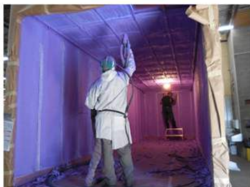
Isolation à l'uréthane giclé