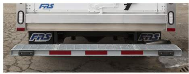
Pare-choc extra robuste entièrement galvanisé à chaud