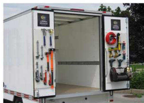
Possibilité d'accrocher les outils sur les portes arrières