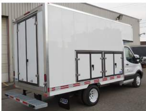
Portes latérales pour coffres à outils