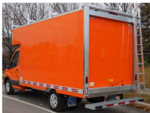
Support à échelle Peinture de la boîte/camions à la demande