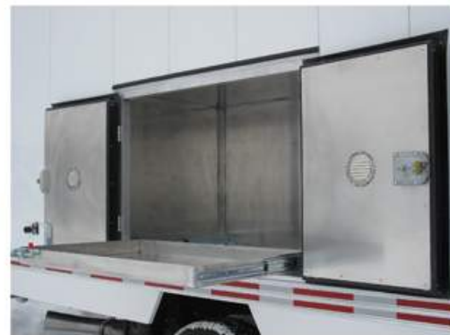
Coffre de deux portes ventilées avec plateau installé sur glissières