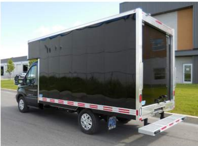
Peinture du camion et de la boîte