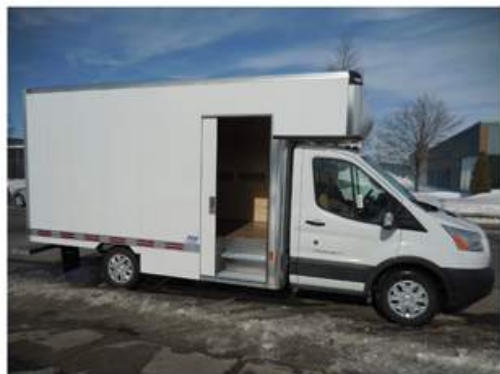
Porte coulissante avec transit