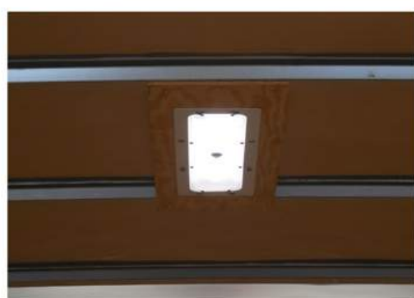
Plafonnier encastré de type Grote D.E.L. avec détecteur de présence à infrarouge (sans interrupteur)