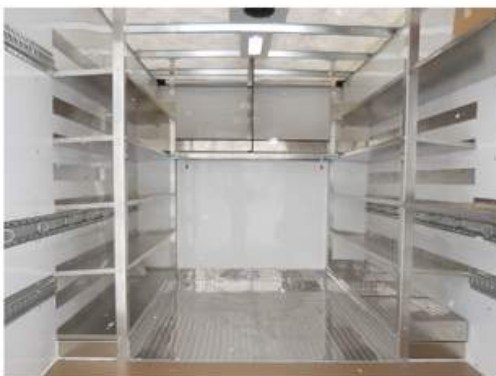
Finition intérieure en «Loan Plastique», toit translucide, différents types de tablettes de rangement en aluminium