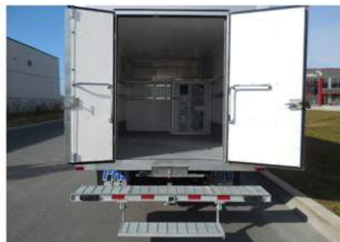
Deux portes arrières 20" et 30" Pare-choc avec attache de remorque et demi marche rétractable